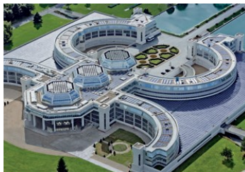
Zlepšenie environmentálneho správania (hore: Challenger, správa spoločnosti Bouygues Construction budova s pozitívnuu energetickou bilanciou)