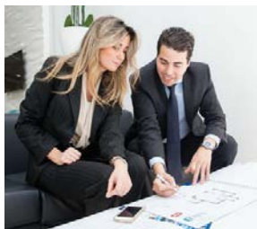
Podpora odborného rastu zamestnancov Skupiny

Spoločenská zodpovednosť Skupiny (CSR) je integrovaná do jej obchodnej stratégie, a ako prostriedky vplyvu na výkon a poskytovania zdrojov inšpirácií a výziev. Je zameraná na zosúladenie sa s dlhodobými globálnymi výzvami v aktuálnom ekonomickom kontexte.